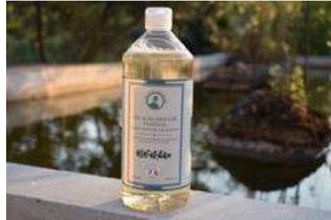
Fortifiant : Ortie-Achillée-Sauge-Citron