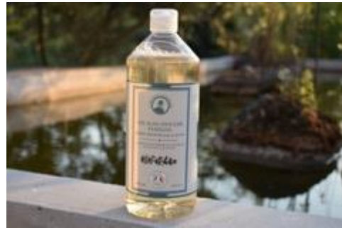
Fortifiant : Ortie-Achillée-Sauge-Citron