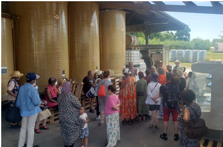
Visite du producteur de jus de pomme vendu par VRAC en Normandie - juillet 2022