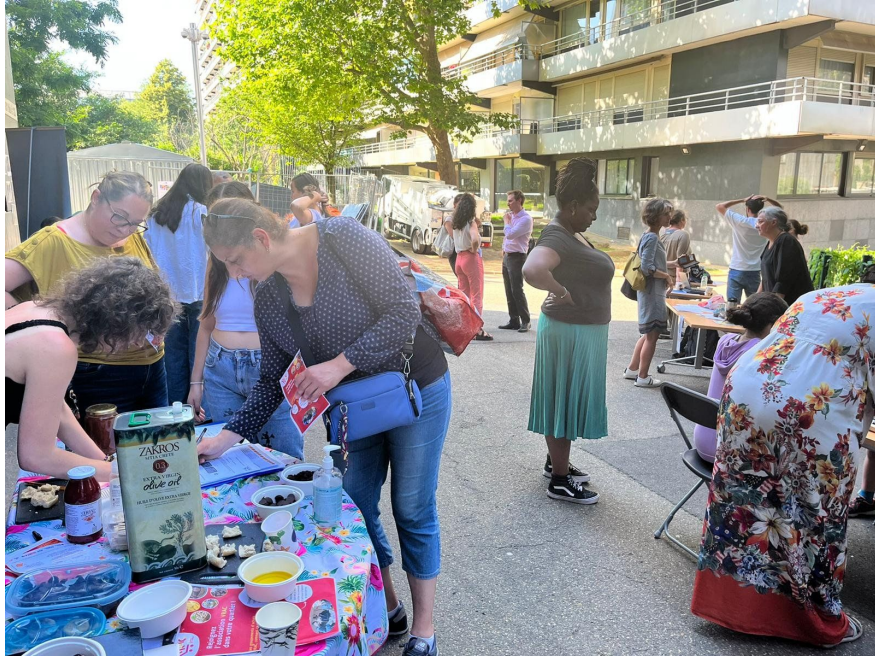
Dégustation et présentation de l'association - 13e - juin 2022