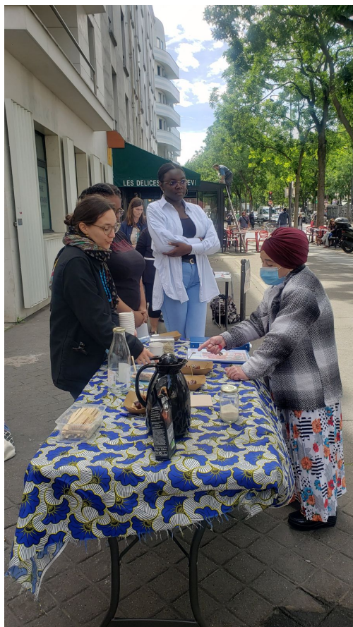
Dégustation pied d'immeuble - 19e - juin 2022