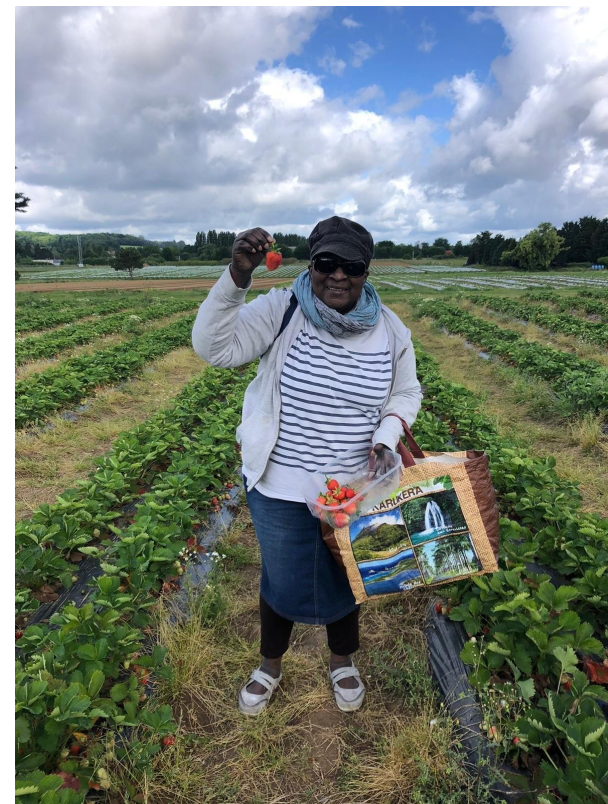
Cueillette avec les habitants d'un groupement - mai 2022