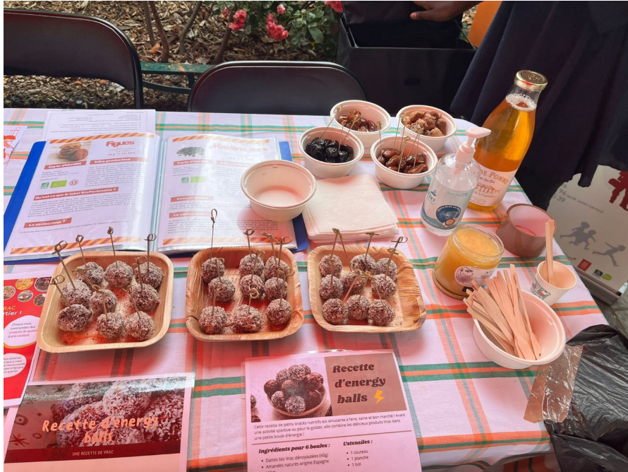
Fête de quartier des Amandiers (20e) - juin 2022