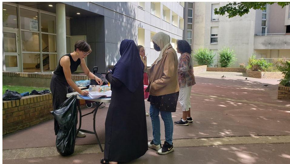
Dégustation de pied d'immeuble - 20e - juin 2022