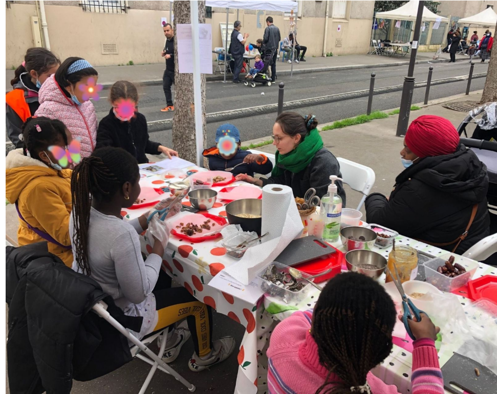
Rue aux enfants - atelier energy balls - 18e - mars 2022