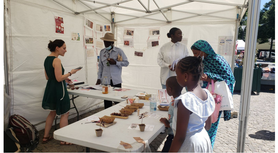
Festival du Mieux Manger - 19e - Juillet 2022