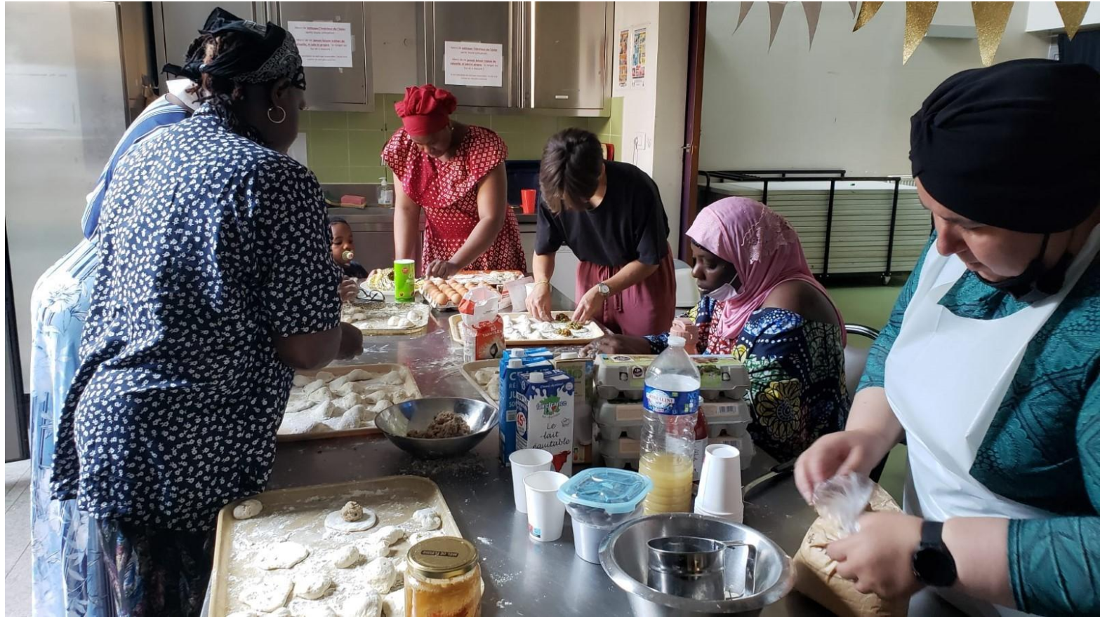
Atelier de cuisine - Centre socioculturel Maurice Noguès - août 2022