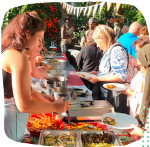
Concours de cuisine