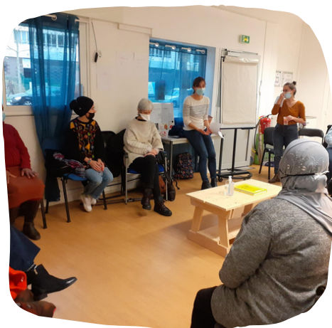
Collectifs démocratie alimentaire (Lyon et Paris)