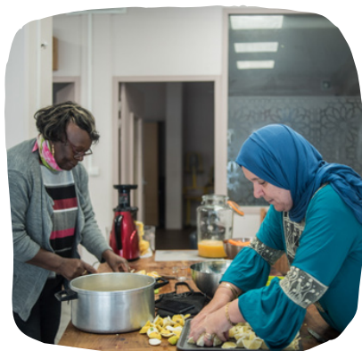
Maison Engagée et Solidaire de l'Alimentation (Lyon)