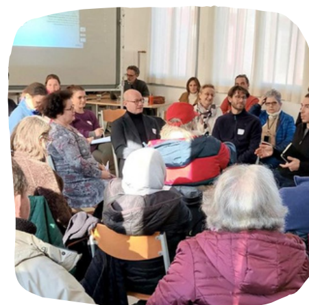
Collectif Acclimat'action (Bordeaux)