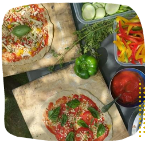
Animations autour de la cuisine