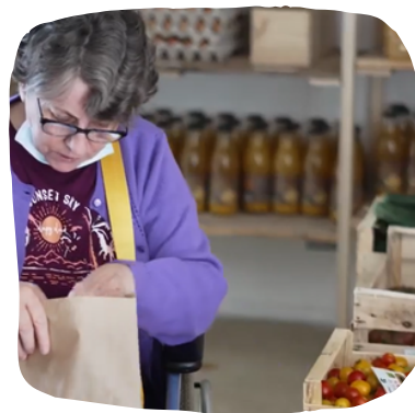
Maison Popotte (Floirac)