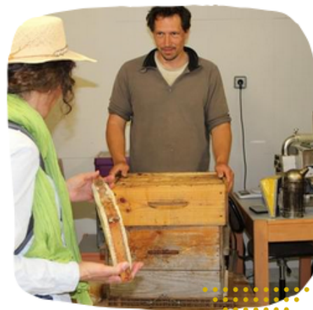
Visites chez les producteurs et productrices